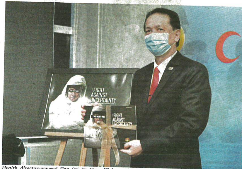
Health director-general Tan Sri Dr Noor Hisham Abdullah launching the book 'The Fight Against Uncertainty: Hospital Services Journey in Combating Covid-19', at the Health Ministry in Putrajaya yesterday.

"Up to noon today (yesterday), 1,481 patients have been dis-