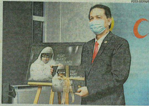
Dr Noor Hisham melancarkan buku The Fight Against Uncertainty: Hospital Services Journey in Combating Covid-19 di Kementerian Kesihatan, Putrajaya pada Khamis.

"Peperangan masih belum tamat dan semakin sengit. Kita perlu bersatu dan kesepaduan akan membezakan sama ada kita akan menangani Covid-19 dengan baik," katanya kepada pemberita selepas majlis pelancaran buku mewah berjudul The Fight Against Uncertainty: Hospital Services Journey in Combating Covid-19 yang dilaksanakan secara maya di sini