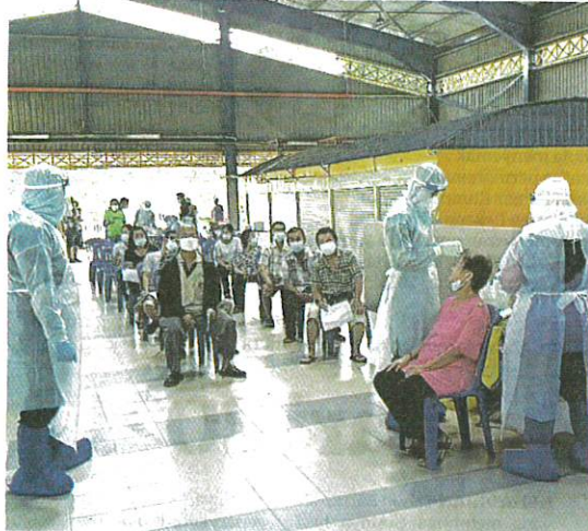
PROSES saringan terhadap peniaga dan pekerja di Pasar Awam Banting, Kuala Langat semalam.

Tan Sri Dr. Noor Hisham Abdullah berkata, sebanyak 49 kluster melaporkan pertambahan kes dengan peningkatan tertinggi adalah Kluster Seruling (371 kes), Kluster Penjara Jalan Harapan